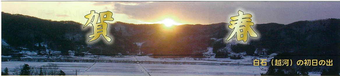
白石(越河)の初日の出