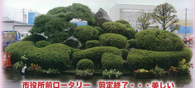
市役所前ロータリー 剪定終了・・・美しい