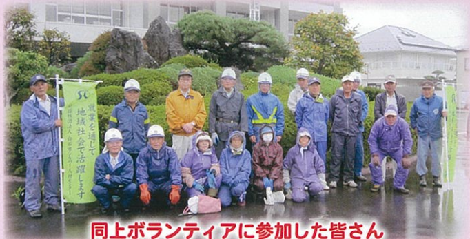
同上ボランティアに参加した皆さん