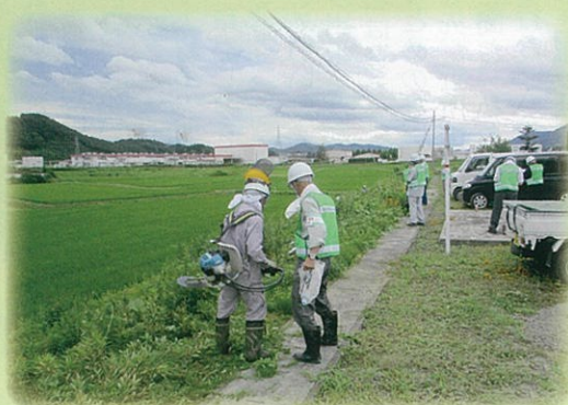
(*剪定講習は、計画されていますが、今回の掲載、間に合いませんでした。)