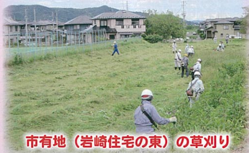
市有地(岩崎住宅の東)の草刈り