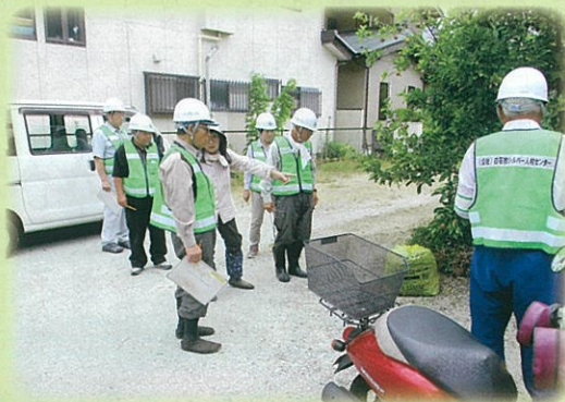
上・下安全パトロールで指導と激励 (7月5日)