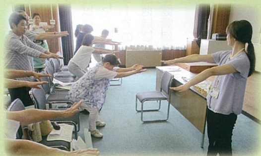
健康管理講習 (7月20日)