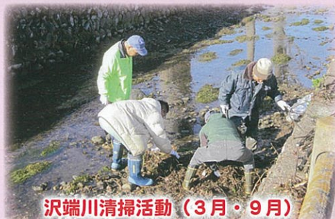
沢端川清掃活動(3月・9月)